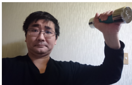
ダンベルで 上腕二頭筋を鍛えたり